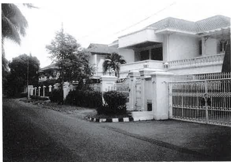
ジャカルタ市内の高級住宅(筆者は左奥のペンションに滞在)

危険の為、JICAより14日以降外出禁止の命令が出、センターに指導に行くことが出来なくなってしまった。その後は、日本でも報道されたとおりで、計画は中断され、緊急避難で帰国した次第である。「イ国」の政情により指導半ばにして帰国せざるをえなくなってしまったことは大変残念であった。